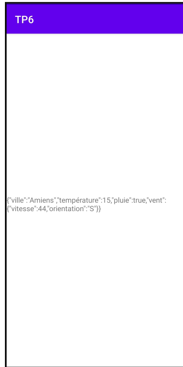
FIGURE 1 – Affichage du premier bulletin météo.

Question 6 Créez une classe WeatherView qui hérite de ConstraintLayout . Un tel objet aura trois attributs de type TextView nommés villeView , tempView et ventView , qui sont destinés à contenir respectivement le nom de la ville, la température, et les informations sur le vent.