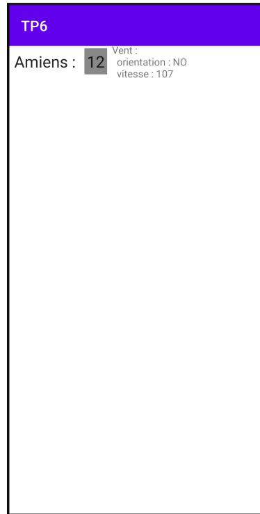
FIGURE 3 – Aperçu d'une WeatherView .

La pluie, ou son absence, sera représentée par la couleur de tempView : s'il pleut, celle-ci sera grise, sinon elle sera bleue. On utilisera pour cela la méthode View::setBackgroundColor() .